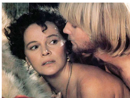
1985 LA VÉNITIENNE (La Venexiana) de Mauro Bolognini avec Jason Connery