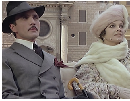
1975 DIVINE CRÉATURE (Divina Creatura) de Giuseppe Patroni Griffi avec Terence Stamp