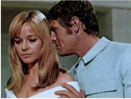
1969 VÉNUM EN FOURRURE (La Malizia di Venere) de Massimo Dallamano avec Régis Vallée