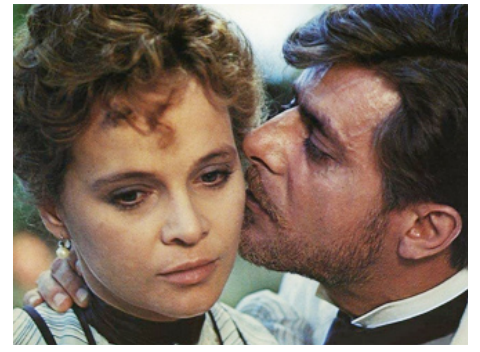
1975 L'INNOCENT (L'Innocente) de Luchino Visconti avec Giancarlo Giannini