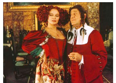
1989 L'AVARE (L'Avaro) de Tonino Cervi avec Alberto Sordi