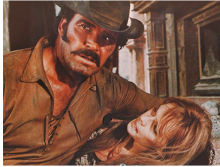
1969 UN NOMMÉ SLEDGE (A Man called Sledge) de Giorgio Gentili avec James Garner