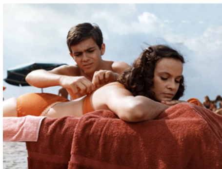
1973 PÉCHÉ VÉNIEL (Peccato veniale) de Salvatore Samperi avec Alessandro Momo