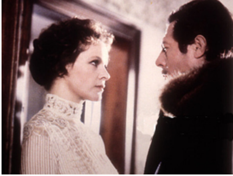
1977 LA MAÎTRESSE LÉGITIME (Mogliamante) de Marco Vicario avec Marcello Mastroianni