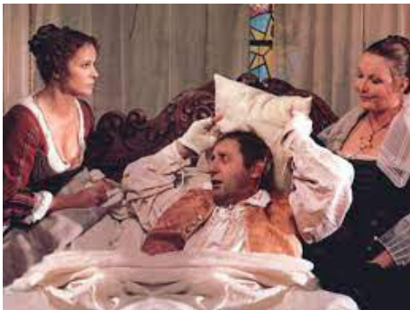
1979 LE MALADE IMAGINAIRE (Il Malato immaginario) de Tonino Cervi avec Alberto Sordi, Marina Vlady