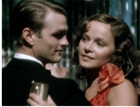
1977 BLACK JOURNAL (Gran Bollito) de Mauro Bolognini avec Antonio Marsina