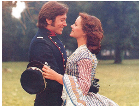
1980 PASSION D'AMOUR (Passione d'amore) d'Ettore Scola avec Bernard Giraudeau