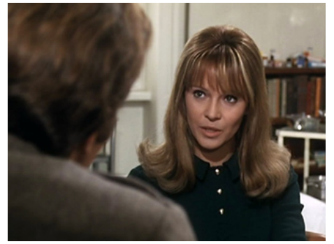
1969 UN DÉTECTIVE (Macchie di Belletto) de Romolo Guerrieri avec Franco Nero