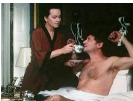
1985 L'ENCHAÎNÉ (La Gabbia) de Giuseppe Patroni Griffi avec Tony Musante