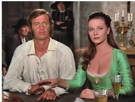
1970 LES MARIÉS DE L'AN II de Jean-Paul Rappeneau avec Jean-Paul Belmondo