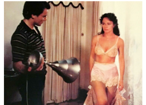
1981 ROSA (Casta e pura) de Salvatore Samperi avec Christian De Sica