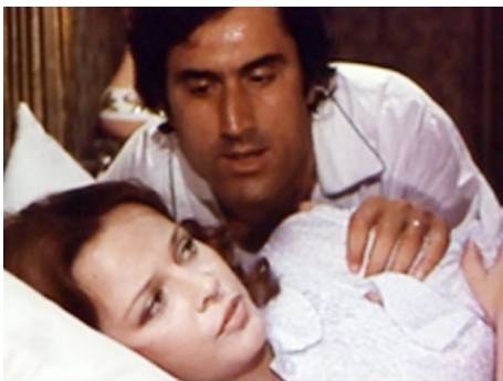
1971 MA FEMME EST UN VIOLON (Il Merlo maschio) de Pasquale Festa Campanile avec Lando Buzzanca