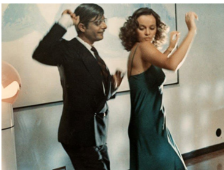
1973 SEXE FOU (Sessomato) de Dino Risi avec Giancarlo Giannini