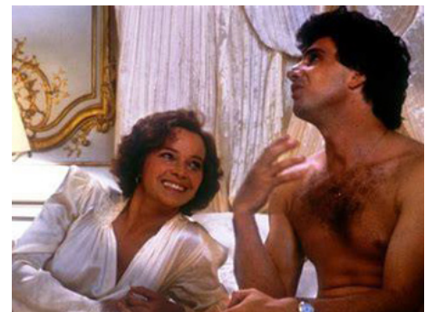
1984 TRANCHES DE VIE de François Leterrier avec Michel Boujenah