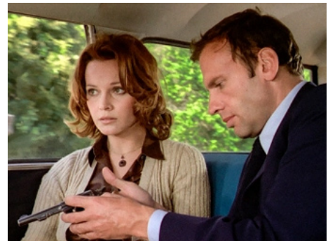
1971 SANS MOBILE APPARENT de Philippe Labro avec Jean-Louis Trintignant