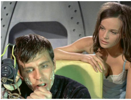
1966 L'ESPION QUI VENAIT DU SURGELÉ (Dr Goldfoot & the Girl Bombs) de Mario Bava avec Fabian