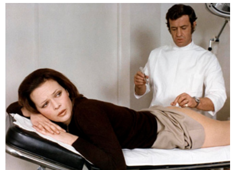
1972 DOCTEUR POPAUL de Claude Chabrol avec Jean-Paul Belmondo