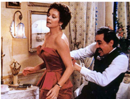
1981 LE TOURNANT (Il Turno) de Tonino Cervi avec Vittorio Gassman